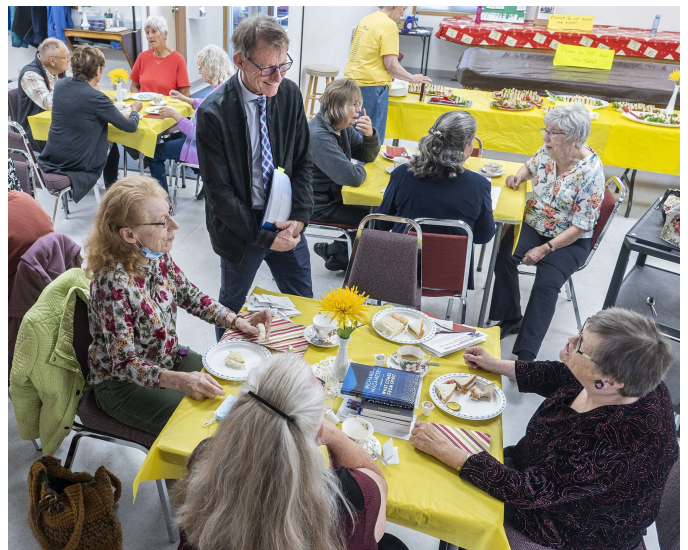
Rencontre avec des aînés lors d'un thé que nous avons organisé à la Golden Age Society de Whitehorse pour discuter des programmes et du soutien aux aînés, septembre 2022.

Le temps que j'ai passé à Ottawa au cours de l'année écoulée a été consacré à l'établissement de relations, à la discussion et à la promotion de changements dans les politiques, tout en soulignant les enjeux du Yukon auprès de mes collègues députés et des membres du Cabinet. Et ils en tiennent compte : pas moins de neuf ministres ont donné la priorité à une visite de notre territoire au printemps et à l'été (plus d'informations sur ces visites en page 4). Avec chaque vote ou déclaration à la Chambre des communes, ou lors d'une réunion de comité, je vise à promouvoir les intérêts du Yukon.