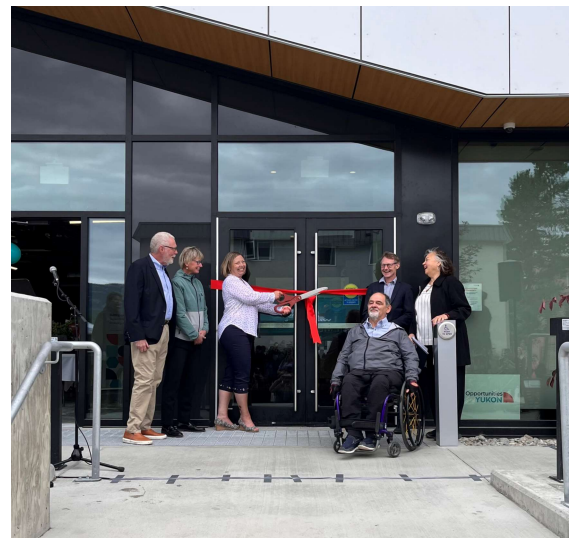
Célébration de la grande ouverture de l'édifice Cornerstone, juillet 2022.

En juillet dernier, nous avons célébré l'ouverture de l'édifice Cornerstone sur la rue principale à Whitehorse, offrant 45 logements locatifs abordables aux personnes en situation de handicap, à risque de devenir sans-abri ou ayant besoin d'un logement sûr. Cet immeuble à usage mixte de six étages comprend des services intégrés d'aide à l'emploi et à la formation, une salle médicale pour répondre aux besoins des résidents en matière de santé, huit condominiums au prix du marché, un café, des espaces de vente au détail, des bureaux et un salon où les gens peuvent se réunir et organiser des ateliers. Le gouvernement du Canada a contribué plus de 15,1 millions de dollars à ce projet par le programme FNCIL, avec des contributions supplémentaires du gouvernement du Yukon et de la ville de Whitehorse.